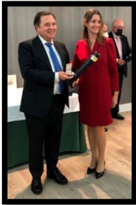
Grupo Filatélico y Numismático de Gijón (2020)