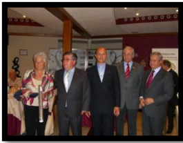
Federación Asturiana de Sociedades Filatélicas (2011)